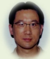
姚雪彪，教授（中国科技大学）

利用活体显微成像方法，实时记录神经细胞的发育过程，深入对细胞不对称分裂，细胞迁移和细胞凋亡等分子机制的理解。2011年入选中组部“青年千人计划”，2013年获第一届千人专家“青科奖”，2015年获“杰青”。本课程中负责细胞器成像、线虫成像等前沿讨论。